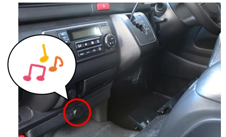
(図1) メロディスピーカー

※ 後部ボタンを押さずに車から離れた場合は、クラクションを断続的に鳴らして警告します。