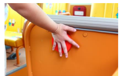
(図4) SOS ボタン