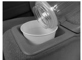
※お茶やコーヒーなどに