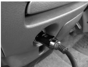
※電源はシガーソケットから。