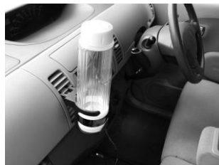
※ポット本体は安定した場所に。