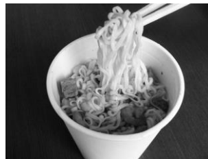
※カップラーメンなどに